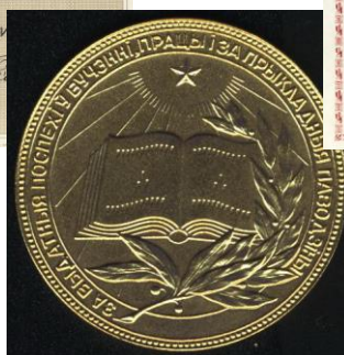
Фотография моей мамы в 1982 году, а также мамина золотая медаль