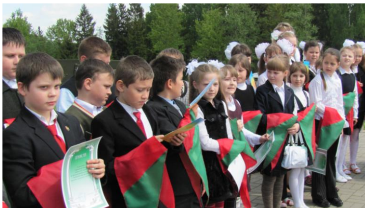
19 мая 2011 года. Я и мои товарищи

Моя мечта осуществилась 19 мая 2011 года, в День пионерской дружбы. Все четвероклассники вступили в ряды ОО «БРПО» в мемориальном комплексе «Линия Сталина».